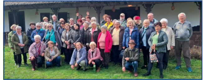
A Kiss József Helytörténeti Gyűjtemény előtti csoportkép