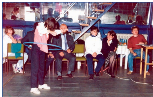
1995. 05. 05. – Vetélkedő