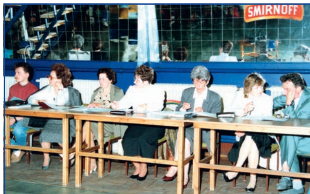
1995. 05. 05. – A vetélkedő zsűrije